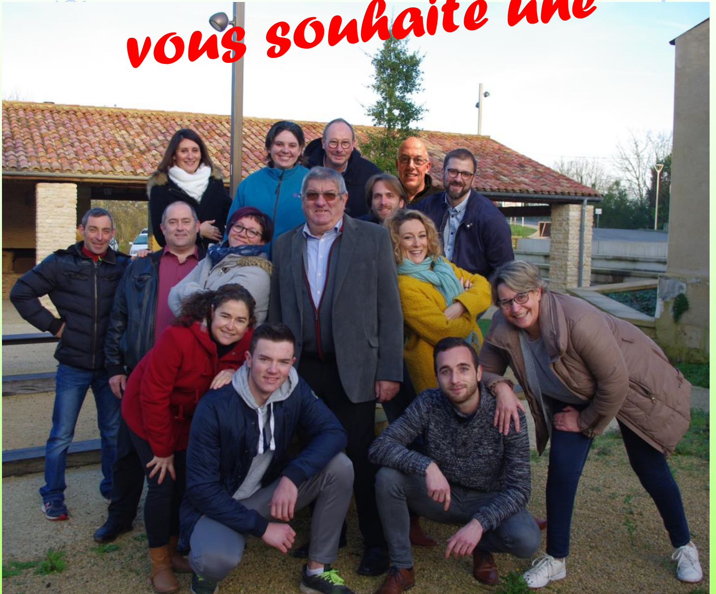
Photo prise hors contexte sanitaire pendant les préparatifs aux élections municipale

Toute l'équipe municipale vous souhaite une